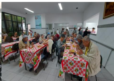
Almoço Especial dia do Idoso