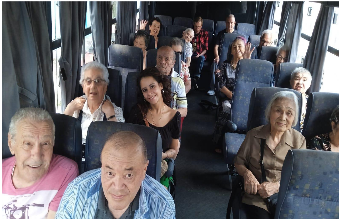
Ida a Evento no Clube Esportivo da Penha

MATRIZ: Rua Dona Vicentina Alegretti, 265 – CEP 03610-030 – Tel.: (11) 2164-1800 / Fone/Fax: (11) 2164-1810 – Penha – SP UNIDADE II: Rua Georgina Diniz Braghiroli, 128 – CEP 08031-560 – Fone/Fax: (11) 2035-3113 – Vila N. Curuçá – São Miguel Paulista – SP UNIDADE III: Rua Frei Caneca, 280 – CEP 08579-630 – Tel.: (11) 4648-2404 – Bairro Pequeno Coração – Itaquaquecetuba – SP Site: www.abrigobezerrademenezes.org.br / E-mail: abrigo@abrigobezerrademenezes.org.br / Facebook.com/abrigobezerrademenezes