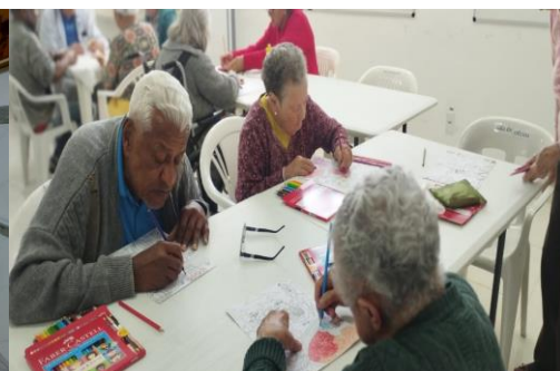
Oficina de Pintura

4.7. Metas: beneficiar os idosos das duas unidades, em situação de vulnerabilidade social e promover a inclusão dos mesmos na rede, com o objetivo de acolhimento e inserção na sociedade.