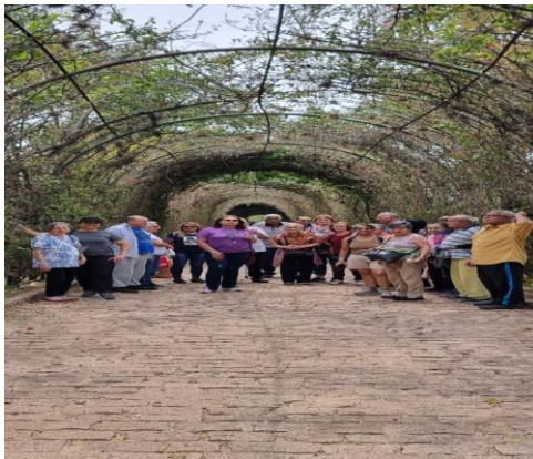
Passeio ao Parque Maeda

Obs.: eventos internos e externos são agendados durante o ano conforme oferta.