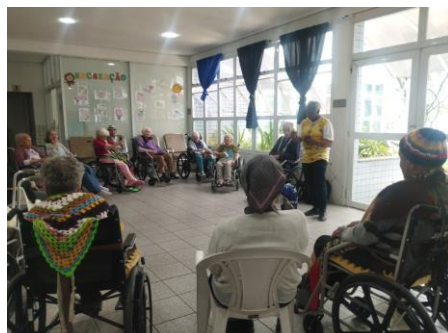
Oficina de Música

- Semana do Idoso: no mês de setembro, na Semana do Idoso são organizadas nas duas unidades atividades diárias para os idosos, tais como sessão de cinema, apresentação de coral e danças, atividades interativas, festas em comemoração a data e etc. Ao final de cada atividade a assistente social e a orientadora socioeducativa constataam o grau de satisfação dos envolvidos;