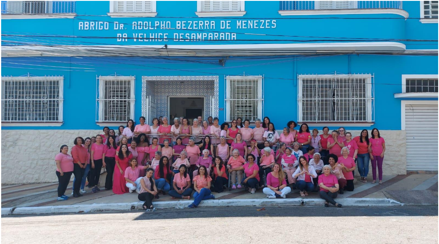
Encontro de idosas e funcionárias no Outubro Rosa