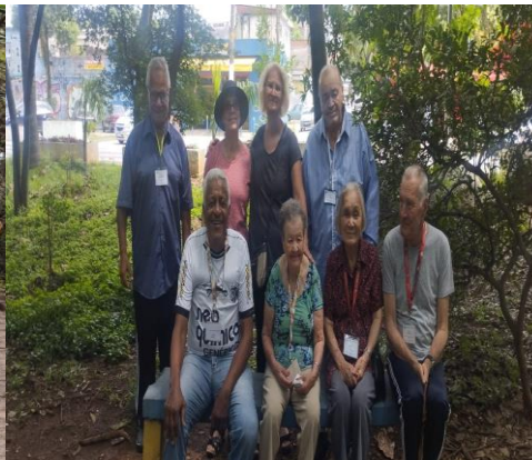
Caminhada no Parque